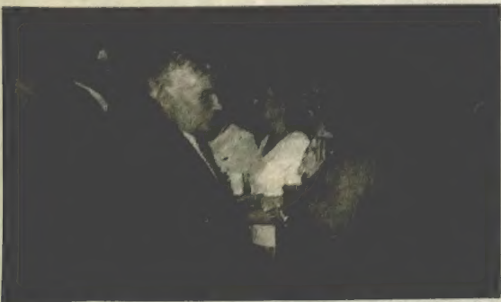
На выставе «Беларускія мастакі»